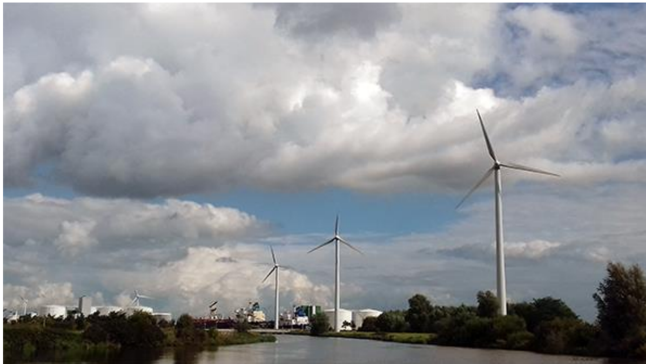
Foto genomen voor de woningen naast het gemaal met rechts het N1 terrein (met de windmolens), op de achtergrond links de tanks van Oiltanking met rechts ervan de vrachtschepen. De woonwagenlocatie bevindt zich direct links van het water.

In het Hoofdrapport regionaal risicoprofiel 2012 staat dat een incident met giftige stoffen in Westpoort grote impact kan hebben, met mogelijke effectgebieden tot in bewoond gebied. En daar wonen wij.