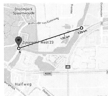
Afstand Zijkanaal F West 23 en festivalterrein N1: 1,39 kilometer