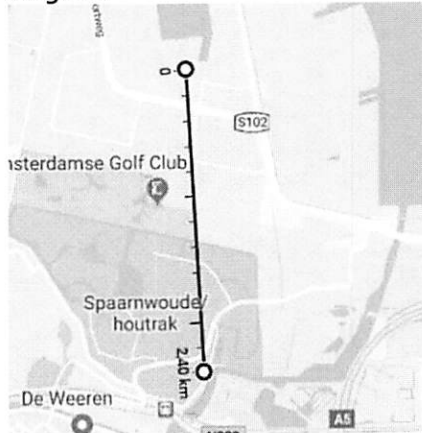
Afstand Zijkanaal F West 23 en Ruigoord: 2,4 kilometer