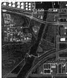
Festival terrein N1